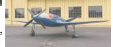
L'avion de la fin des années 30 qui obtint le record Bugatti de vitesse de l'air est exposé au musée AirVenture à Oshkosh dans le Wisconsin, aux USA.