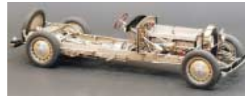
En plus des voitures de course, Bugatti a produit toutes sortes de voitures de route, dont la 'Royale' (12 l), créée en 1926