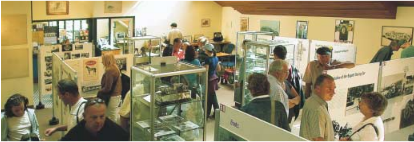
Vue du centre d'études à Prescott où sont exposés de nombreux objets 'Bugatti'

Ettore Bugatti (1881-1947) est peut-être le mieux connu pour ses voitures de course des années '20 et '30, reconnues autant pour leurs prouesses sur les circuits de course qu'en tant qu'oeuvres d'art.