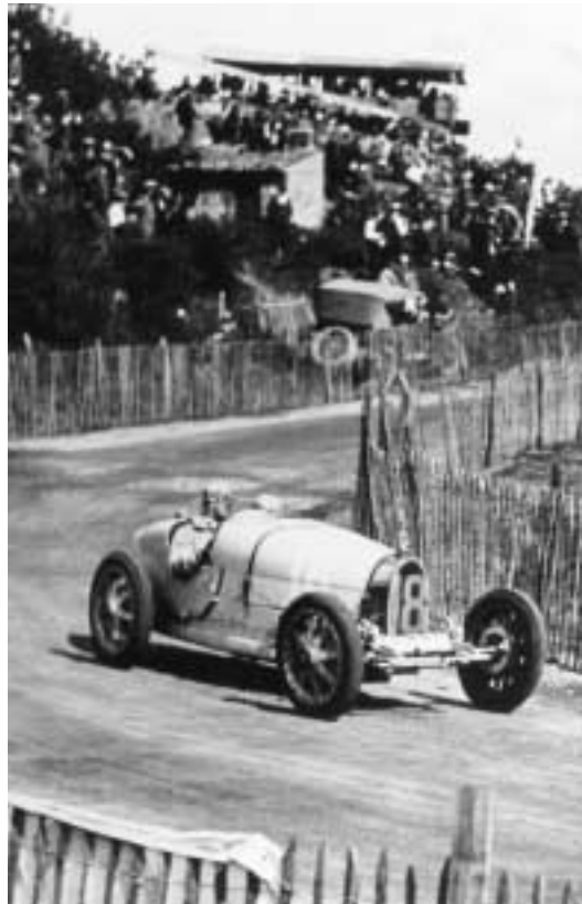
De nos archives: 'Le Grand Prix de l'A.C.F. 1924 à Lyon.' Le Type 35 s'est par la suite confirmée comme étant l'une des voitures de course les plus couronnées de succès.

Sans formation reconnue en ingénierie, Ettore Bugatti a su toutefois élaborer un style et une méthode de travail fondés de toute évidence sur le talent et l'audace qui lui étaient propres. S'il a subi parfois des revers, l'ensemble de son oeuvre est néanmoins marqué par une intégrité de dessin sans compromis, alliée au déploiement simple et logique des matières. Lui-même a décrit ses oeuvres comme étant de pur sang .