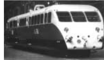
Un autorail Bugatti du milieu des années 30. Venant remplacer les locomotives lourdes de l'âge de la vapeur, ces autorails étaient largement utilisés en France et gagnèrent le record mondial de la vitesse.