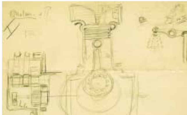
Une esquisse originale d'Ettore Bugatti d'un moteur 'écologique' pour une voiture à essence ou électricité

The Bugatti Trust est ouvert de 10h à 16h du lundi au vendredi ou par arrangement.