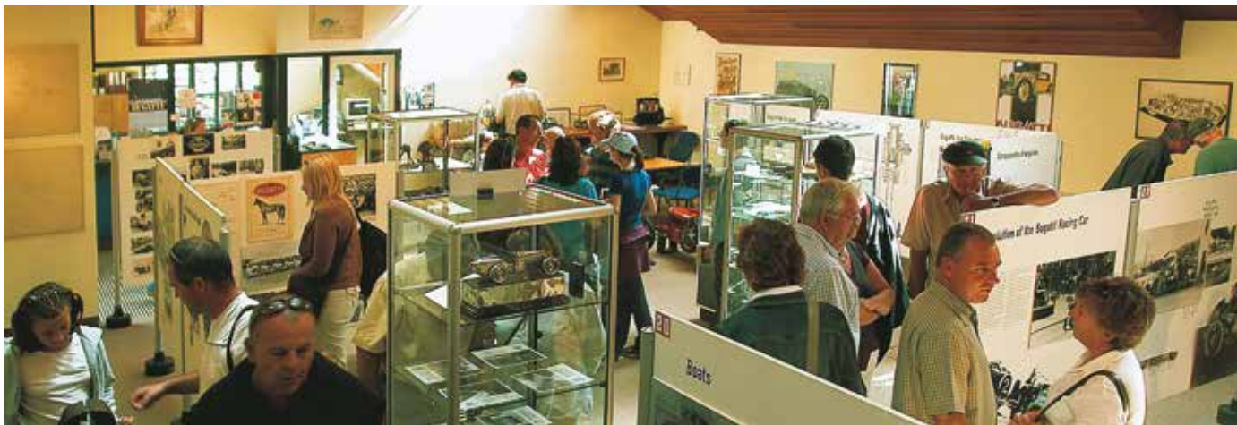
Una sala del Centro Studi a Prescott dove sono esposti numerosi oggetti 'Bugatti'

Ettore Bugatti (1881–1947) si è guadagnato la fama per le sue auto da corsa degli anni '20 e '30 che, oltre ad aver vinto molte gare, sono state riconosciute come opere d'arte.