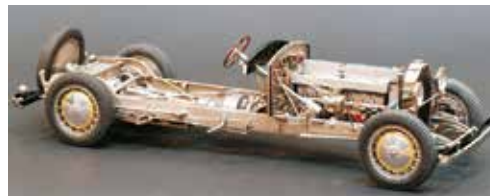
Oltre alle auto da corsa, Bugatti produsse vari tipi di auto da strada, inclusa la 'Royale' 12 litri disegnata nel 1926.