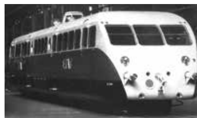
Un vagone ferroviario Bugatti della metà degli anni '30. Rimpiazzando le pesanti locomotive dell'era del vapore, questi treni furono ampiamente utilizzati in Francia ed ottennero il record di velocità mondiale.