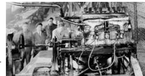
Un motore di aeroplano della Bugatti, durante la Prima Guerra Mondiale – al collaudo in America.