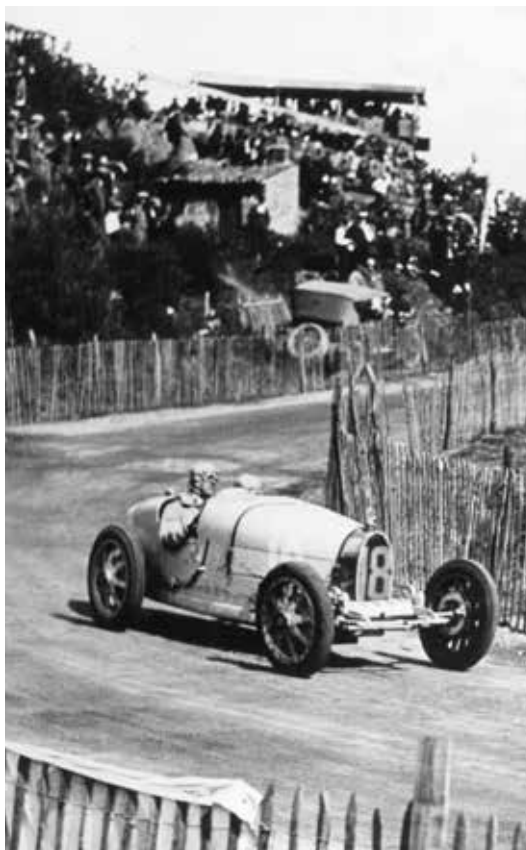
'Il Gran Prix di Francia del 1924 a Lione' – la Bugatti Type35 si conferma come una delle auto da corsa tra le più vincenti.

Ettore Bugatti non aveva intrapreso studi d'ingegneria ma sviluppò uno stile e un metodo di lavoro presumibilmente basato sul suo talento e sull'audacia che gli erano propri. Nonostante alcuni fallimenti clamorosi, tutto il suo lavoro si distingue per un'integrità di design senza compromessi sostenuta da un uso dei materiali semplice e logico. Egli stesso definì le sue opere 'purosangue'.