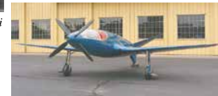
L'aeroplano creato alla fine degli anni '30 per battere il record mondiale di velocità per aerei è esposto al Museo AirVenture in Oshkosh nel Wisconsin, Stati Uniti d'America.