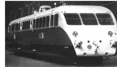
Un autorail Bugatti du milieu des années 30. Venant remplacer les locomotives lourdes de l'âge de la vapeur, ces autorails étaient largement utilisés en France et gagnèrent le record mondial de la vitesse.