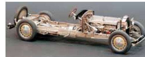
En plus des voitures de course, Bugatti a produit toutes sortes de voitures de route, dont la 'Royale' (12 L), créée en 1926