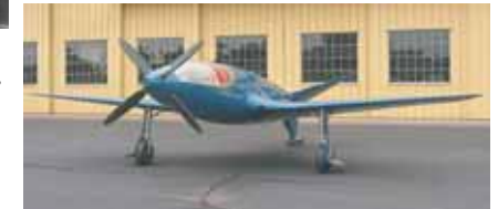
L'avion crée à la fin des années 30 en vue de battre le record mondial de vitesse de l'air est exposé au musée AirVenture à Oshkosh dans le Wisconsin, aux USA.