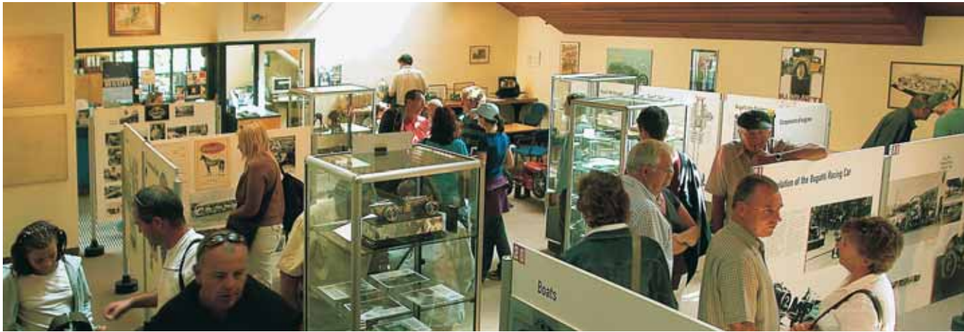
Vue du centre d'études à Prescott où sont exposés de nombreux objets 'Bugatti'

Ettore Bugatti (1881-1947) est peut-être le mieux connu pour ses voitures de course des années '20 et '30, reconnues autant pour leurs prouesses sur les circuits de course qu'en tant qu'œuvres d'art.