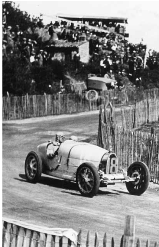
De nos archives: 'Le Grand Prix de l'A.C.F. 1924 à Lyon.' Le Type 35 s'est par la suite confirmé comme étant l'une des voitures de course les plus couronnées de succès.

Sans formation reconnue en ingénierie, Ettore Bugatti a su toutefois élaborer un style et une méthode de travail fondés de toute évidence sur le talent et l'audace qui lui étaient propres. S'il a subi parfois des revers, l'ensemble de son oeuvre est néanmoins marqué par une intégrité de dessin sans compromis, alliée au déploiement simple et logique des matières. Lui-même a décrit ses oeuvres comme étant de pur sang .